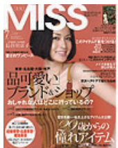
■MISS 2007年 7月号