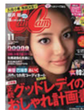
■CanCan 2011年 11月号