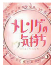
■メレンゲの気持ち 2008年 10月