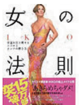
■女の法則 2007年 7月