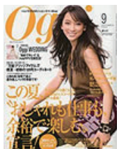
■Oggi 2009年 9月号