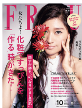
■FRaU 2015年 10月号