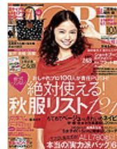
■MORE 2011年 10月号