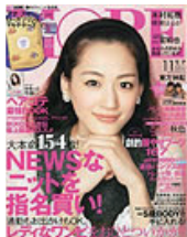
■MORE 2011年 11月号