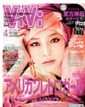
■ViVi 2010年 4月号