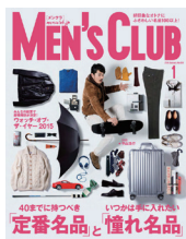
■MEN'S CLUB 2016年 1月号