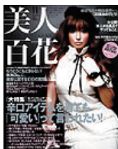
■美人百花 2009年 11月号