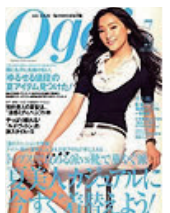
■Oggi 2008年 7月号