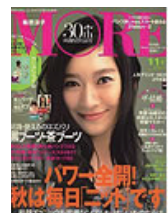
■MORE 2007年 11月号