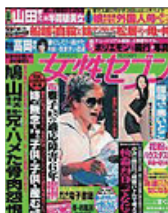
■女性セブン 2010年 3月号