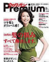
■クロワッサン Premium 2009年 9月号