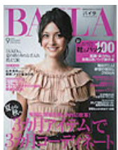
■BAILA 2009年 9月号