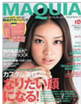
■MAQUIA 2011年 10月号